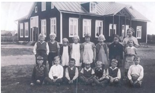
Tararps skola 1947.

Skolan som nu är billackering byggdes 1908-1910 och stängdes i början på 1960 talet. Skolan i Nötabråne byggdes redan 1875.